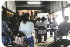
おてらカフェ金剛寺の終了後にて