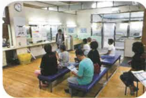
三条浴場の脱衣場にて