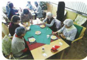
きららかふえ（認知症カフェ）