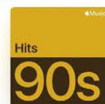
1990年代 洋楽 ベスト Apple Music 1990年代